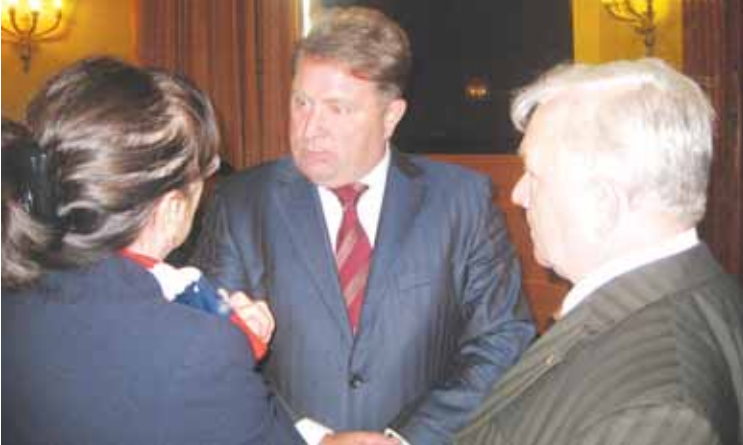
Дискуссия на Меньшиковских чтениях: в центре – Депутат Государственной Думы РФ, председатель Общероссийского Движения Поддержки Флота, капитан 1 ранга запаса, кандидат политических наук Михаил Ненашев.