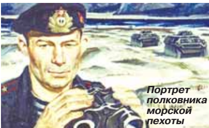
Портрет полковника морской пехоты