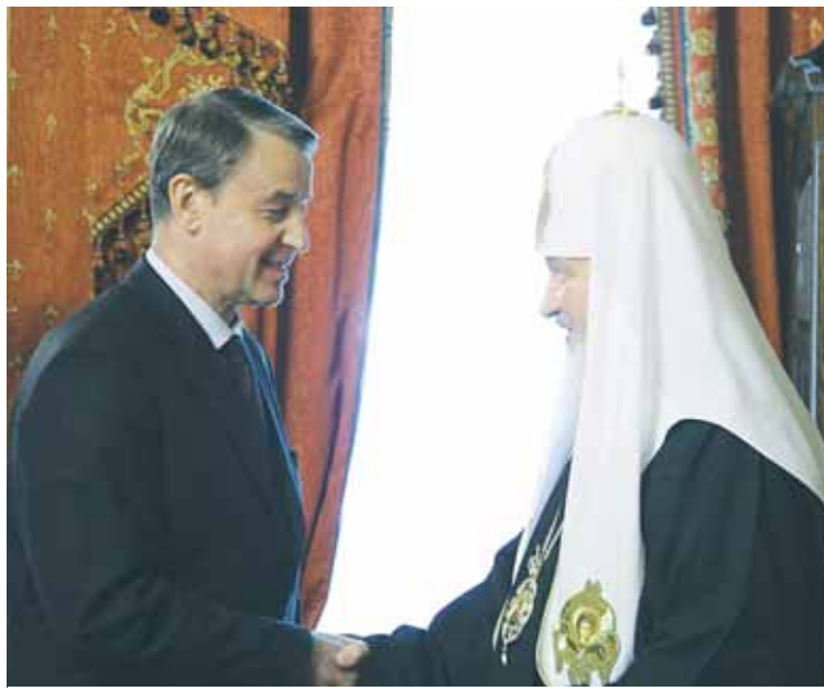
Министр культуры России Александр Авдеев и Святейший Патриарх Московский и всея Руси Кирилл. 3 июля 2009г.

В 2008 году Минкультуры России утвердило «Концепцию сохранения и развития нематериального культурного наследия народов Российской Федерации на 2009-2015 годы». В 2007 году была учреждена ежегодная премия Правительства РФ «Душа России» за заслуги в развитии народного творчества. Её получают творческие люди разных поколений из всех регионов России. Те, кто хранит сегодня традиции народной и фольклорной культуры, хранит душу России, душу народа. Песни и танцы, исполняемые ими, народные промыслы, мастерство изготовле-