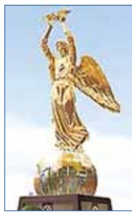
«Добрый Ангел», г. Москва