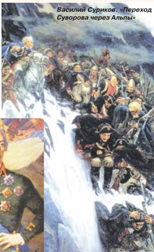
Василий Суриков. «Переход Суворова через Альпы»

подвига русских в Альпах. Нельзя не отметить, что величественный памятник был воздвигнут в 1898 г. на деньги всё того же С.М. Голицына. До сих пор приезжающие сюда соотечественники и иностранцы находятся под сильным впечатлением от суровой природы и, по существу, неприступной позиции, которую суворовские «чудо-богатыри» всё-таки взяли.