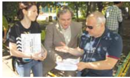
В фильме «Женщина без чувства юмора»

– Мы очень по-разному воспитаны. Общего воспитания не хватает. А кино, очевидно, требует своего киновоспитания; ответственного и патриотического подхода организаторов и контроля со стороны власти. Про что-то очень плохое, увиденное на экране один мой знакомый Народный артист сказал, что за такое надо расстреливать. Естественно сгоряча сказал. Но он не одинок, так рассуждая. Понятно, что расстреливать, никто никого не будет. А вот «за державу обидно», и это яснее ясного.