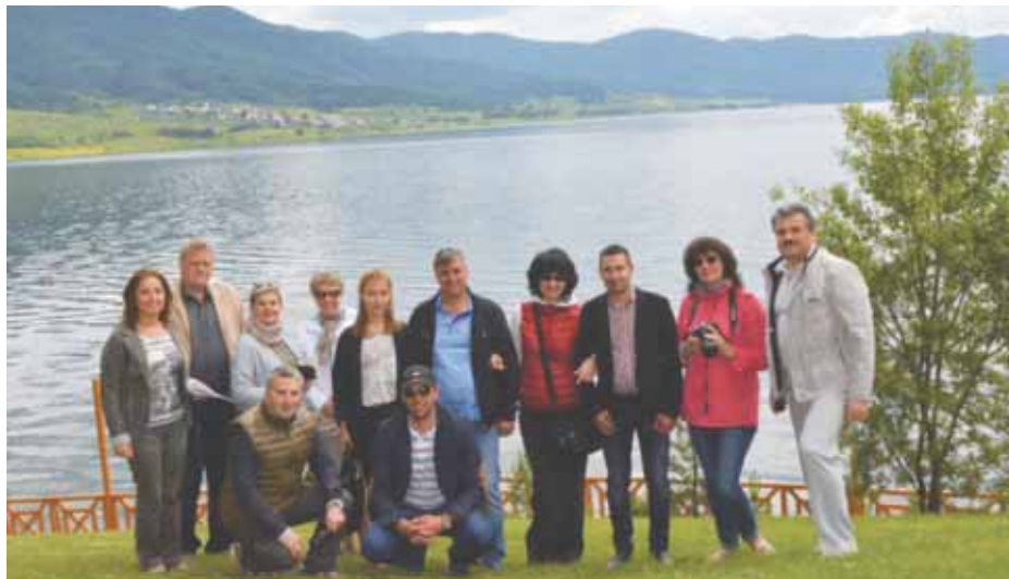
В окрестностях г. Велинграда

Также большой интерес у журналистов вызвали экскурсии по историческим местам: Плиоценский парк и древняя крепость Цепина близ села Дорково, пещера «Лепеница», городской музей и др.