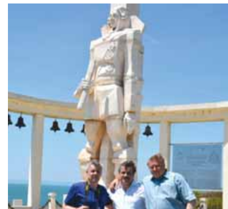
У памятника русскому адмиралу Феодору Ушакову на мысе Калиакра

Здесь же находится второй памятник – русскому адмиралу Феодору Ушакову . Он тут не случаен: 11 августа 1791 года во время русско-турецкой войны у мыса происходило сражение при Калиакрии, в котором русский флот под командованием адмирала разбил турецкие и алжирские корабли. Это было последнее морское сражение русско-турецкой войны 1787-1791 годов. За победу при Калиакрии Феодору Ушакову был пожалован орден святого Александра Невского .