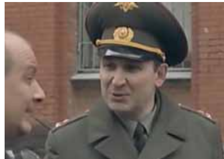
В фильме «Личная жизнь следователя Савельева»

– Западное кино – это красивая, динамичная сказка, с элементами эротического романтизма, ничего общего с действительностью не имеющее. Обратите внимание на то, что, когда действие западного фильма начинается в России, то становится смешно. Потому что – такая неправда, что и смотреть неинтересно. Тот же самый фильм! Только действие перенеслось в Москву. И стали видны все белые нитки такого кино. Герои вернулись в Америку – снова стало интересно. Почему? Нам показывают часто ерунду, и мы с удовольствием смотрим, потому что не знаем западный менталитет, не знаем их жизнь. И дело не в деньгах, которых