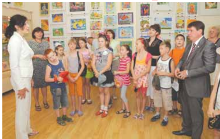
Член Совета Федерации Федерального Собрания Российской Федерации от Республики Крым Сергей Цеков с учителями и детьми

Поэтому Сергей Цеков рассказал участникам встреч о том, что