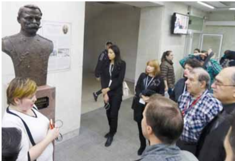
В музее истории Владимирского университета

В городе Суздаль журналисты ознакомились с историей и новейшими технологиями реновации Главного туристического комплекса «Суздаль», который расположен в живописной долине реки Каменка – в 250 км от Москвы. Древний Спасо-Евфимиев монастырь и автомагистраль находятся в нескольких минутах езды. К услугам гостей здесь имеются спа-салон, оздоровительный центр и Wi-Fi. В нескольких ресторанах, кафе и барах, оформленных в современном и русском стилях, подают блюда традиционной русской кухни.