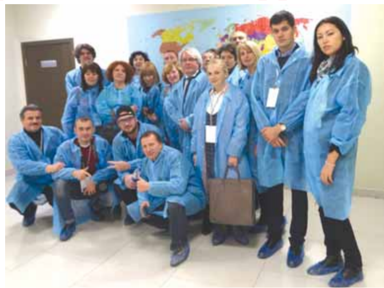
На экскурсии в ЗАО «РМ Нанотех»

лось так, что это – основа богатства нашего государства, её развития и процветания. Однако, как и везде на планете, биологическому разнообразию России грозит сокращение. Главная причина в том, что люди стали ценить своё материальное благополучие выше, чем сохранение природы как источника этого благополучия. Наука,