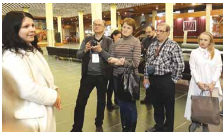
В Главном туристическом комплексе «Суздаль»

В Культурно-туристическом торговом комплексе «Золотые ворота» (дер. Крутово Петушинского района Владимирской области), где представлены ведущие производители товаров России и стран ближнего зарубежья, журналистам показали и рассказали о товарном ассортименте центра, который включает в себя предметы народных художественных промыслов, домашний текстиль, хрусталь и предметы интерьера. В основе концепции «Золотых ворот» – прямая работа с производителями без посредников.