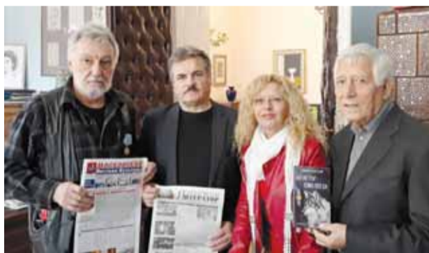
Встреча в Союзе писателей Сербии

Сербия расположена на перекрестке культур, а её территория веками была во власти турков, австро-венгров, болгар. Эти факты оказали огромное влияние на развитие страны, в том числе повлияли на культуру. Помимо этого, значительный вклад в культурное развитие внесла и Россия, которая покровительствовала Сербии даже в самые тяжёлые для балканской страны годы. Традиции русской литературы оказали большое влияние на развитие сербской литературы, начиная с ранних этапов формирования последней и вплоть до сегодняшнего дня, о чём свидетельствуют многочисленные переводы русских классиков и современных писателей на сербский язык.