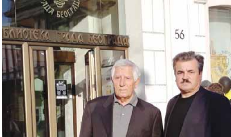
Главная библиотека г. Белграда отметила свой 85-й день рождения