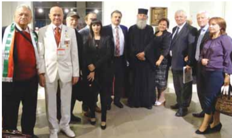
Делегаты II Славянского конгресса