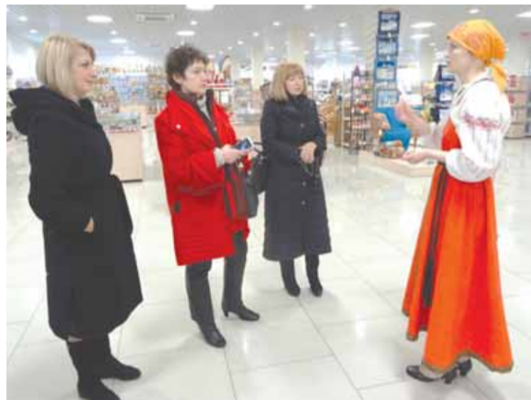
В Культурно-туристическом торговом комплексе «Золотые ворота»