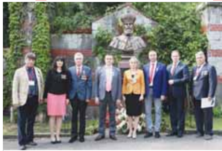
У памятника Государю Императору Александру Третьему в Массандре