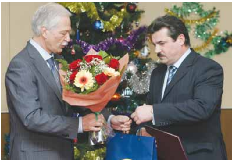
Председатель Государственной Думы Федерального собрания РФ Борис Грызлов награждает Заслуженного работника культуры России, председателя Московского отделения Российского творческого Союза работников культуры Николая Терещука Дипломом и ценным подарком, как одного из лучших парламентских корреспондентов.

творчества, в котором определен целый спектр различных форм поддержки, в том числе и более четкое определение налоговых льгот, льгот по коммунальным платежам, включая жильё.