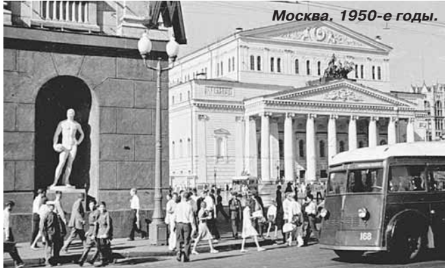
Москва. 1950-е годы.

Так и забылась бы эта история с нервным топтани-