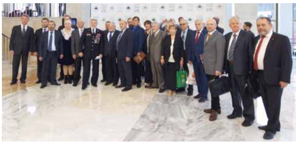
Делегация Союза писателей России на XXII Всемирном Русском Народном Соборе

4. В своём выступлении Владимир Путин чётко назвал основную проблему современного человечества: глобалистские силы прилагают все усилия, чтобы «перформативировать» мир, разрушить традиционные ценности и те культурно-исторические