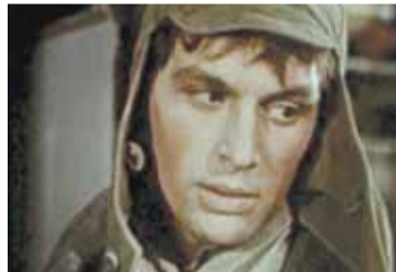
Фильм «Павел Корчагин» (1956)