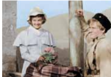
Фильм «Офицеры» (1971)

В марте 2015 года в рамках празднования Дня Победы в Севастополе на Сапун-Горе мы