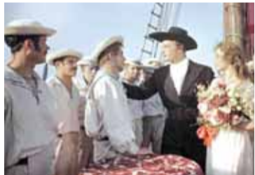
Фильм «Алые паруса» (1961)

– Позднее и до настоящего дня каждый раз, прикасаясь к военной теме в фильме или спектакле, я очень скоро настраиваюсь на эту волну, и «замыкание» наступает мгновенно. Как только возникает какой-то эпизод войны, ассоциативно я тут же нахожу точки сопереживания с пережитым, виденным, и это сразу же во многом определяет мое самочувствие в той или иной военной роли. Иные образы подаются, можно сказать, в готовом виде – я сразу схватываю целое, а затем уже идет работа по уточнению, углублению деталей, отдельных моментов роли. Определил для себя сначала общее направление поисков, главную суть образа, ищу затем внешнюю форму поведения своего героя. Ее не всегда сразу возможно увидеть, она открывается, как правило, постепенно, в процессе репетиций, по крупице, по черточке, по шажочку. Причем поиск внешнего рисунка роли бывает долгим и нередко мучительным. Ведь важно не только знать, что сказать,