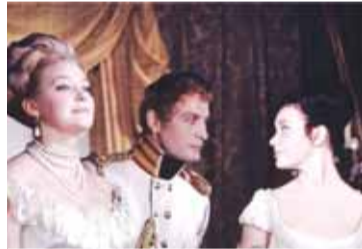
Фильм «Война и мир» (1965-1967)

Когда начал работать над фильмом, понял: самое важное – передать своё внутреннее отношение к войне, к великой трагедии, к которой она привела народы. Признаюсь, что ни одна работа в театре, в кино, на