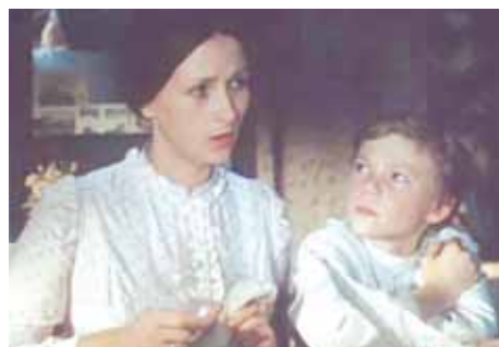
Фильм «Два капитана», 1976 г.