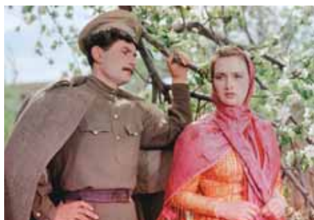
Спётром Глебовым, фильм «Тихий Дон», 1958 г.