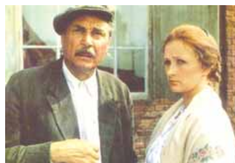
Фильм «Судьба», 1977 г.