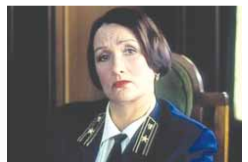
Фильм «Любить по-русски-2», 1996 г.