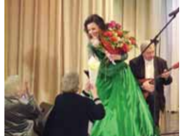
Цветы от благодарных почитателей таланта

– У меня уже есть большое количество дисков с разными программами, но это все – концертная, «живая» запись. Она не слишком совершенна в техническом плане, т.к. там много шумов, помех, хотя и преимуществ тоже немало – есть аплодисменты, чувствуется атмосфера зала, слышна его реакция и «дыхание», да и вообще «возможность единственного дубля» заставляет исполнителя работать с максимальной выкладкой. Но теперь мне хочется сделать сту-