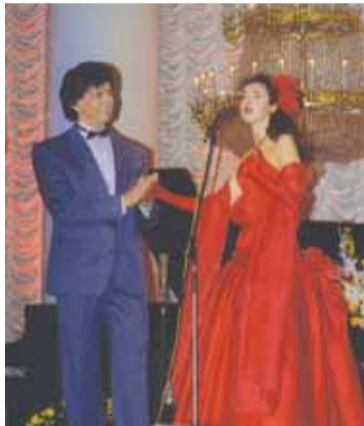
Колонный зал Дома Союзов. С Народным артистом СССР Сергеем Захаровым на Гала-концерте конкурса «Романсиада»

– Да, в разные периоды моей творческой жизни я знакомилась с разными стилями музыки и с разными