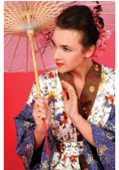
В партии Мадам Баттерфляй из оперы Д. Пуччини «Чио-Чио-Сан»