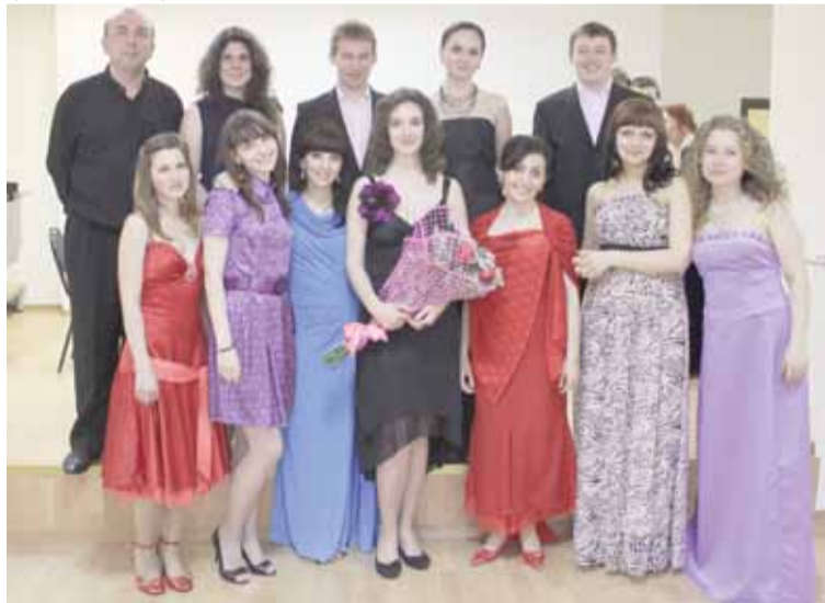
Со своими студентами

ми коллективами и музыкантами, с которыми мне приходилось сотрудничать. Хочу упомянуть, что я концертировала с такими замечательными камерными коллективами, как «Брамс-трио», «Московское трио», трио «Маэстро Классик», камерным оркестром «Инструментальная капелла», ансамблем «Collegium Musicum» и другими ансамблями. Это – незабываемые впечатления. За годы выступлений исполняла самые разнообразные сочинения. Это были оперные арии и оперные партии в спектаклях, камерная вокальная музыка, духовная музыка, музыка из оперетт, романсы и лирические песни.