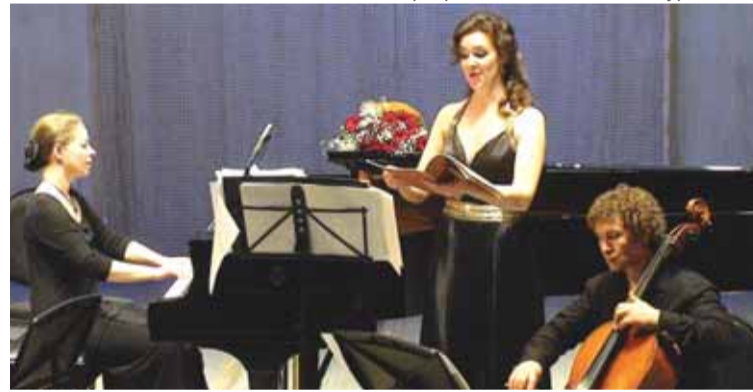
Московский Международный Дом Музыки. Выступление с «Брамс-трио»

Поэтому я поехала туда со спокойной душой. Там за год приобрела глубокое понимание тонкостей стиля произведений французских композиторов, освоила мелодику языка, открыла для себя целый пласт неизвестных и красивейших произведений. А соединение русской вокальной школы и традицией исполнения западноевропейской