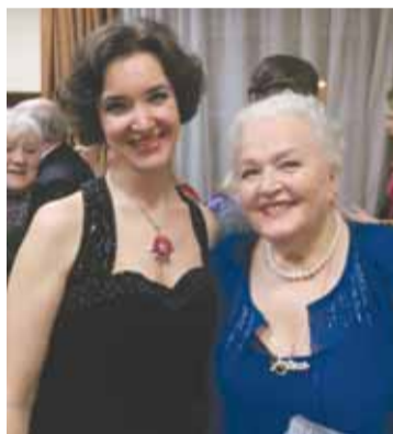
С любимым педагогом – Народной артисткой России Галиной Алексеевной Писаренко

– Да, Галина Алексеевна очень поддержала мое стремление пройти стажировку во Франции, можно сказать, благословила меня.