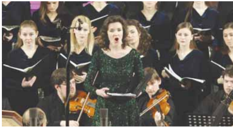
Партия сопрано в оратории Г.Ф. Генделя «Мессия» с хором и оркестром

Я рада, что могу сама выбирать репертуар, который мне хотелось бы исполнять в концертах. Сейчас всё чаще отдаю предпочтение камерной классике и барочной музыке, которая очень полюбилась мне в последнее время. Всё это – произведения разных эпох, стилей, стран. С удовольствием исполняю и музыку современных композиторов. Хотя, и самые любимые оперные арии всегда включаю в концерты, если это соответствует тематике программы.