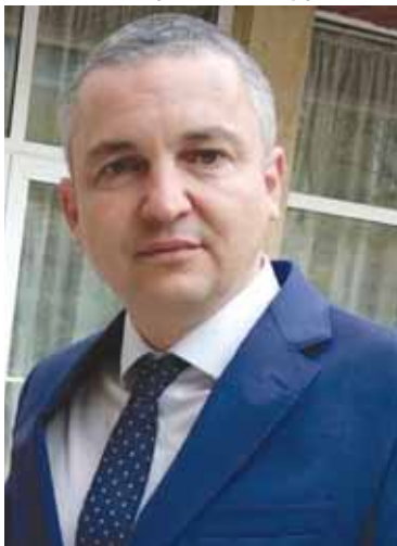
Мэр города Варны Иван Портних

проследовала по центральным улицам города от памятника болгаро-советской дружбы к памятнику советским воинам, где участникам автопробега были возложены венки и цветы. Так жители Варны отметили праздник Великой Победы и почтили память павших героев, среди которых не только советские солдаты, но и сыны и дочери болгарского народа.