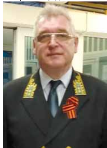
Генеральный консул России в г. Варне Владимир Климанов

К 75-летию Победы в Великой Отечественной войне был выпущен видеофильм «Победители», посвящённый ветеранам войны из России, Болгарии, Израиля, Белоруссии и других стран. В нём рассказывается о героях, которые не вернулись с поля боя, о жизненном пути ветеранов, переживших войну и продолжающих сегодня своим примером воспитывать патриотизм у молодёжи. Эти истории были взяты из семейных архивов и представлены родственниками ветеранов. Видеофильм был размещён на интернет-ресурсах указанных стран (количество просмотров превысило четыре тысячи).